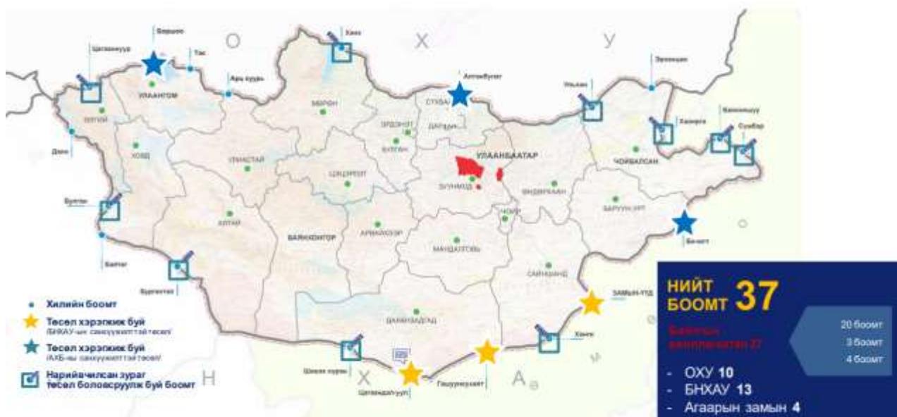
Зураг 6. Шинэ сэргэлтийн бодлогоор ашиглалтад оруулах боомтууд

Ерөнхий сайдын 2022 оны 01-р сарын 11-ны өдрийн “Шинэ сэргэлтийн бодлого хэрэгжүүлж, хөгжлийн төслийн хэрэгжилтийг эрчимжүүлэх тухай” 01 тоот албан даалгаварт Арцсуурь-Нарийнсухайт-Шивээхүрэн чиглэлийн төмөр зам, Бичигт-Хөөт, Хөөт-Чойбалсан чиглэлийн төмөр замыг “Монголын төмөр зам” ТӨХК-ийн удирдлага дор хэрэгжүүлэх боломжийг судалж, саналаа Засгийн газрын хуралдаанд танилцуулахыг даалгасан.