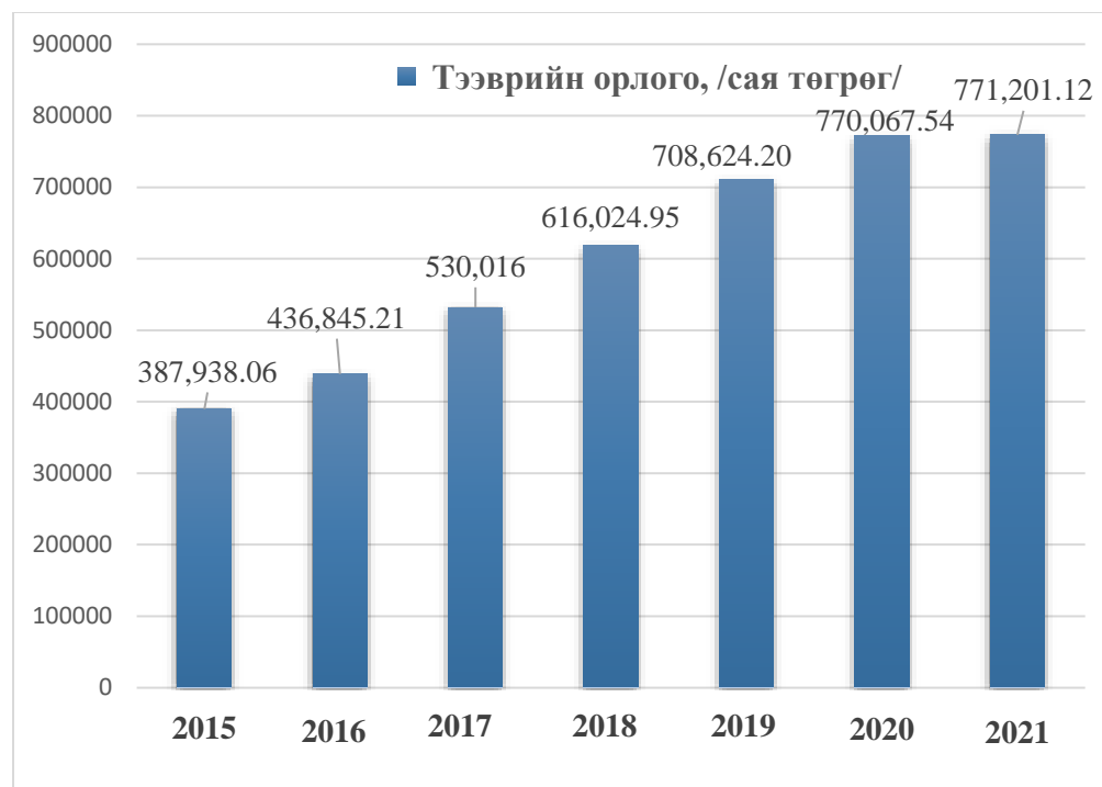
Зураг 1. Монгол улсын төмөр замын тээврийн орлогын харьцуулалт