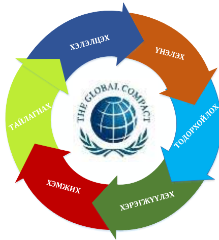
Зураг 7. UN Global Compact Management Model (НҮ-ний Глобал Компакт Менежментийн загвар)