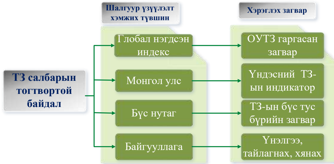
Хүснэгт 2. Төмөр замын салбарын тогтвортой байдлыг үнэлэх шалгуур хэмжүүрүүд /Indicator Framework for the Evaluation of Transport Sustainability Performance /