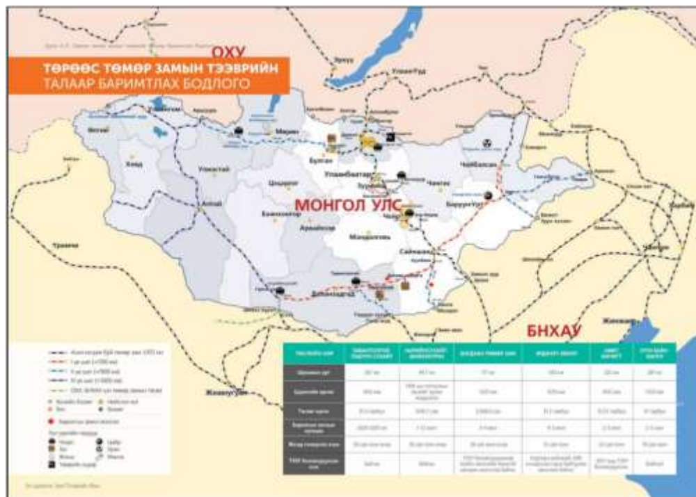
Зураг 5. Төрөөс төмөр замын тээврийн талаар баримтлах бодлогоор барих төмөр зам

Монгол Улсын Их Хурлын 2010 оны 32 дугаар тогтоолоор “Төрөөс төмөр замын тээврийн талаар баримтлах бодлого”-ыг баталсан бөгөөд энэхүү бодлогын баримт бичигт Монгол Улсад ойролцоогоор 5683,5 км төмөр замын суурь бүтцийг 3 үе шаттайгаар барихаар шийдвэрлэсэн. Мөн тус тогтоолоор эхний ээлжинд баригдах төмөр замын бүтээн байгуулалтын ажлыг 2010 онд багтаан эхлүүлэхийг Засгийн газарт үүрэг болгосон. Төрөөс төмөр замын тээврийн талаар баримтлах бодлогын зорилго нь: Төмөр замын тээх, нэвтрүүлэх чадварыг нэмэгдүүлэх, ирээдүйд өсөн нэмэгдэх тээвэрлэлтийн эрэлт хэрэгцээг үр дүнтэй, найдвартай хангахад чиглэсэн үр ашигтай үндэсний төмөр замын дотоодын нэгдсэн сүлжээг өргөжүүлж, улмаар улс орны дамжин өнгөрүүлэх чадавхийг дээшлүүлэн, салбарын эрх зүйн орчин, бүтэц, зохион байгуулалтыг боловсронгуй болгох, ашигт малтмалын томоохон ордуудыг ашиглах, тэдгээрийн бүтээгдэхүүнийг экспортлох болон боловсруулан экспортолж улсын эдийн засаг, нийгмийн хөгжлийг хурдасгах, ирээдүйн тогтвортой хөгжлийг хангахад оршино.